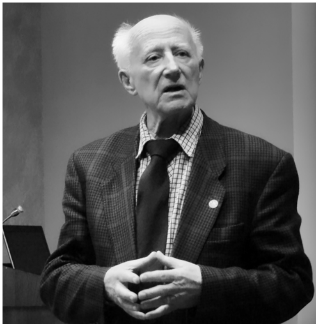
Profesor Jan Machnik w trakcie obrad XXXII Rzeszowskiej Konferencji Archeologicznej (2016 r.). Professor Jan Machnik during the 32nd Rzeszów Archaeological Conference (2016).

Submission: 31.10.2023; Acceptance: 10.12.2023