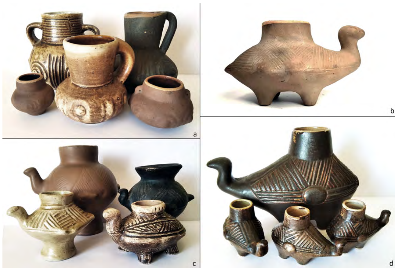
Ryc. 1. Naśladownictwa form naczyniowych kultury łużyckiej wykonywane przez spółdzielnie rzemieślnicze z czasów PRL-u: a – ceramika guzowa; b–d – formy zoo- i ornitomorficzne

Obecnie, wyroby ceramiczne spółdzielni rzemieślniczych z czasów PRL-u, nawiązujące do wzorów archeologicznych, cieszą się ponownym zainteresowaniem. Wytworzył się ogromny rynek kolekcjonerski na te przedmioty, czego dowodem są wysokie ceny osiągane na portalach aukcyjnych. Szczególnie popularne jest naczynie w kształcie żółwia (ryc. 1:d), wzorowane na oryginale z Chobieni, nazywane wśród zbieraczy „świecznikiem” albo „dromaderem”. Niezależnie od przyjętej nazwy istotne jest, że w obecnej dobie ponownie propaguje ono archeologię, podobnie jak inne podobne mu repliki.