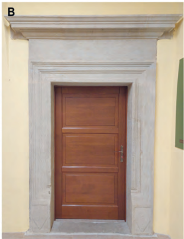
Ryc. 6. Dwór-spichlerz w Zgłobniu. Portal zachowany in situ w sieni, prowadzący do pomieszczenia południowego. A – stan w 2005 r.; B – stan po zakończeniu prac, 2021 r.