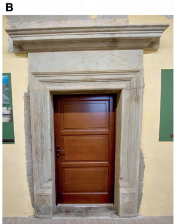
Ryc. 7. Dwór-spichlerz w Zgłobniu. Portal zachowany in situ w sieni, prowadzący do pomieszczenia zachodniego. A – stan w 2005 r.; B – stan po zakończeniu prac, 2021 r.