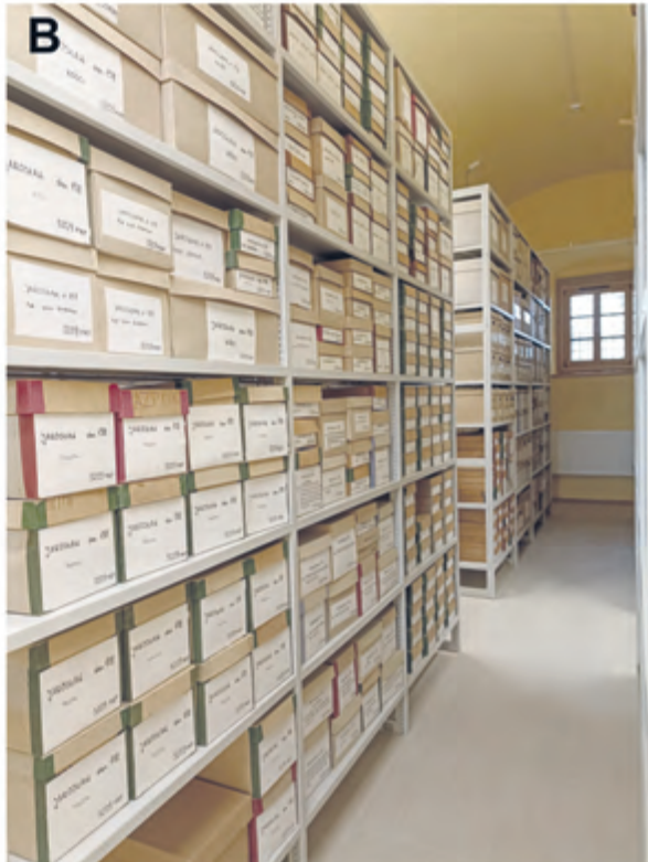
Ryc. 11. Dwór-spichlerz w Zgłobniu. Pomieszczenia magazynowe na strychu (A) i parterze budynku (B). Fig. 11. The manor-granary in Zgłobień. Storage rooms in the attic (A) and on the ground floor of the building (B).