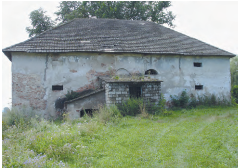
Ryc. 2. Dwór-spichlerz w Zgłobniu – stan w 2005 r.

W roku 1981 na zlecenie Biura Dokumentacji Zabytków w Rzeszowie wykonana została inwentaryzacja konserwatorska obiektu – ówczesnego magazynu Gminnej Spółdzielni „SCH” Boguchwała. Ogólny stan budynku był zły (ryc. 2). W murach