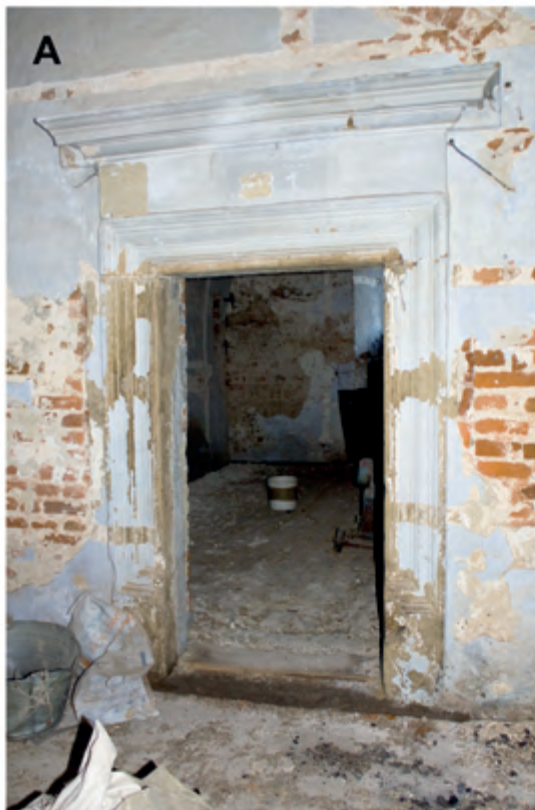
Fig. 6. The manor-granary in Zgłobień. The portal preserved in situ in the entrance hall, leading to the southern room. A – the condition in 2005; B – the condition after completion of works, 2021.