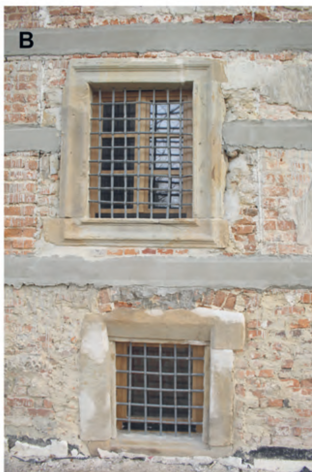
Ryc. 8. Dwór-spiczlerz w Zgłobniu. Elewacja zachodnia dworu z kamieniarką okienną. A – stan w 2005 r.; B – stan w 2015 r.