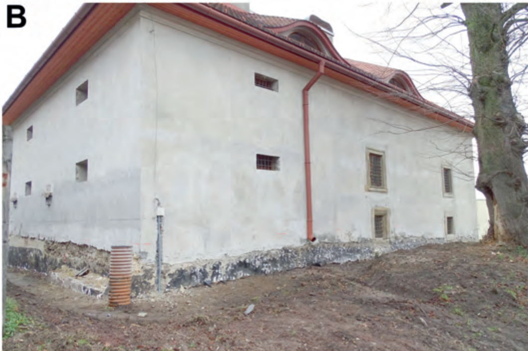
Ryc. 9. Dwór-spichlerz w Zgłobniu. Elewacja zachodnia dworu. A – stan w 2009 r.; B – stan. w 2016 r.