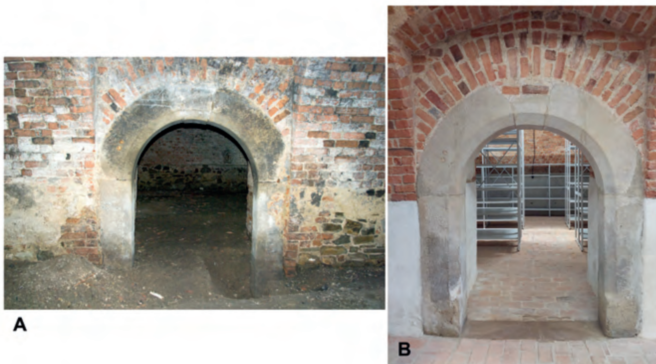
Ryc. 5. Dwór-spichlerz w Zgłobniu. Portal łączący dwa pomieszczenia piwnic. A – stan w 2010 r.; B – stan po zakończeniu prac, 2021 r. Fig. 5. The manor-granary in Zgłobień. The portal connecting two basement rooms. A – the condition in 2010.; B – the condition after completion of works, 2021.