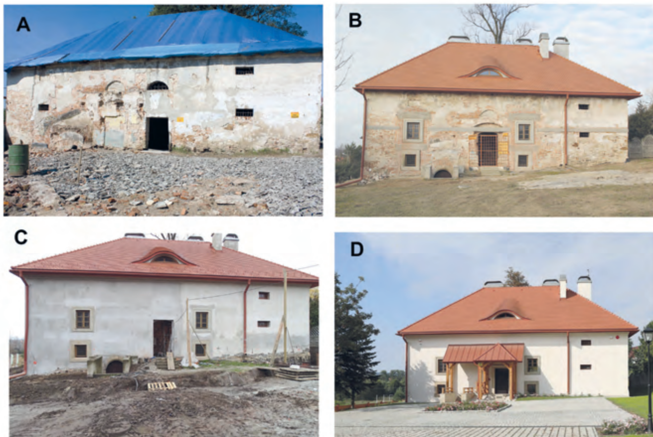
Ryc. 3. Dwór-spiczlerz w Zgłobniu. Regionalna Składnica Zabytków Archeologicznych – elewacja frontowa. A – stan w 2010 r.; B – stan w 2015 r.; C – stan w 2020 r.; D – stan po zakończeniu prac, 2021 r.