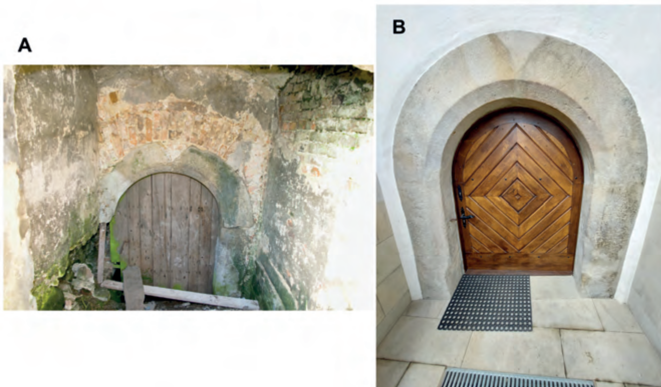
Ryc. 4. Dwór-spichlerz w Zgłobniu. Zejście do piwnic. A – stan w 2005 r.; B – stan po zakończeniu prac, 2021 r. Fig. 4. The manor-granary in Zgłobień. The descent to the basement. A – the condition in 2005; B – the condition after completion of works, 2021.