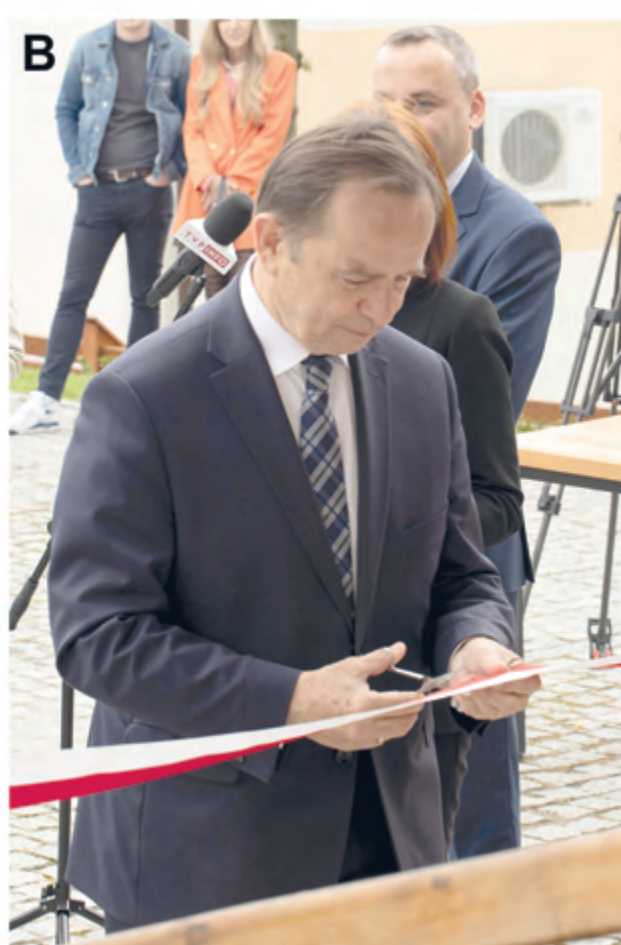
Ryc. 13. Uroczyste otwarcie Regionalnej Składnicy Zabytków Archeologicznych w Zgłobień. Symboliczne przecięcie wstęgi przez Wojewodę Podkarpacką Ewę Leniart (A) i Marszałka Województwa Podkarpackiego Władysława Ortyła (B). Fig. 13. Ceremonial opening of the Regional Storehouse of Archaeological Artefacts in Zgłobień. Symbolic ribbon cutting by Ewa Leniart, Podkarpackie Voivode (A) and Władysław Ortyl, Marshal of the Podkarpackie Voivodeship (B).