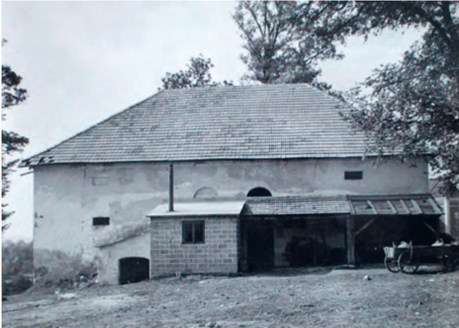
Ryc. 1. Dwór-spiczlerz w Zgłobień. Zdjęcie archiwalne z 1975 r.

Przeprowadzone wówczas obserwacje wykazały, że badany obiekt (fot. 1) jest wynikiem przebudowy pierwotnego budynku, który ograniczał się do podpiwniczonej południowej i środkowej osi obecnej budowli; oś północna natomiast stanowi późniejszą dobudówkę (Holzerowa 1970, 13).