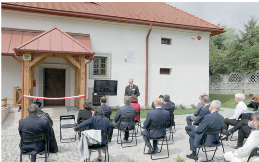
Ryc. 12. Uroczyste otwarcie Regionalnej Składnicy Zabytków Archeologicznych w Zgłobień. Fig. 12. Ceremonial opening of the Regional Storehouse of Archaeological Artefacts in Zgłobień.