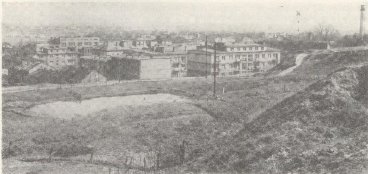
Ryc. 1. Przemysł ul. Stowackiego. Widok wschodniej części stanowiska paleolitycznego obok nowych bloków mieszkalnych.

kopalną, jest zaznaczony jedynie występowaniem węgla drzewnych i materiałów paleontologicznych. Z górnego poziomu kulturowego pochodzą wyroby krzemienne górnopaleolityczne, najprawdopodobniej typu wschodniograweckiego.