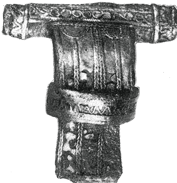
Ryc. 1. Trójczyce, pow. Przemyśl, stan. 1. Zapinka z ćw. 25, sk. A.

Skupisko H — skupienie spalonych kości w warstwie 45—50 cm. Grób 114 — popielnicowy. Naczynie najprawdopodobniej grupy tarnobrzeskiej z zawartością spalonych kości, mocno zniszczone w trakcie orki.