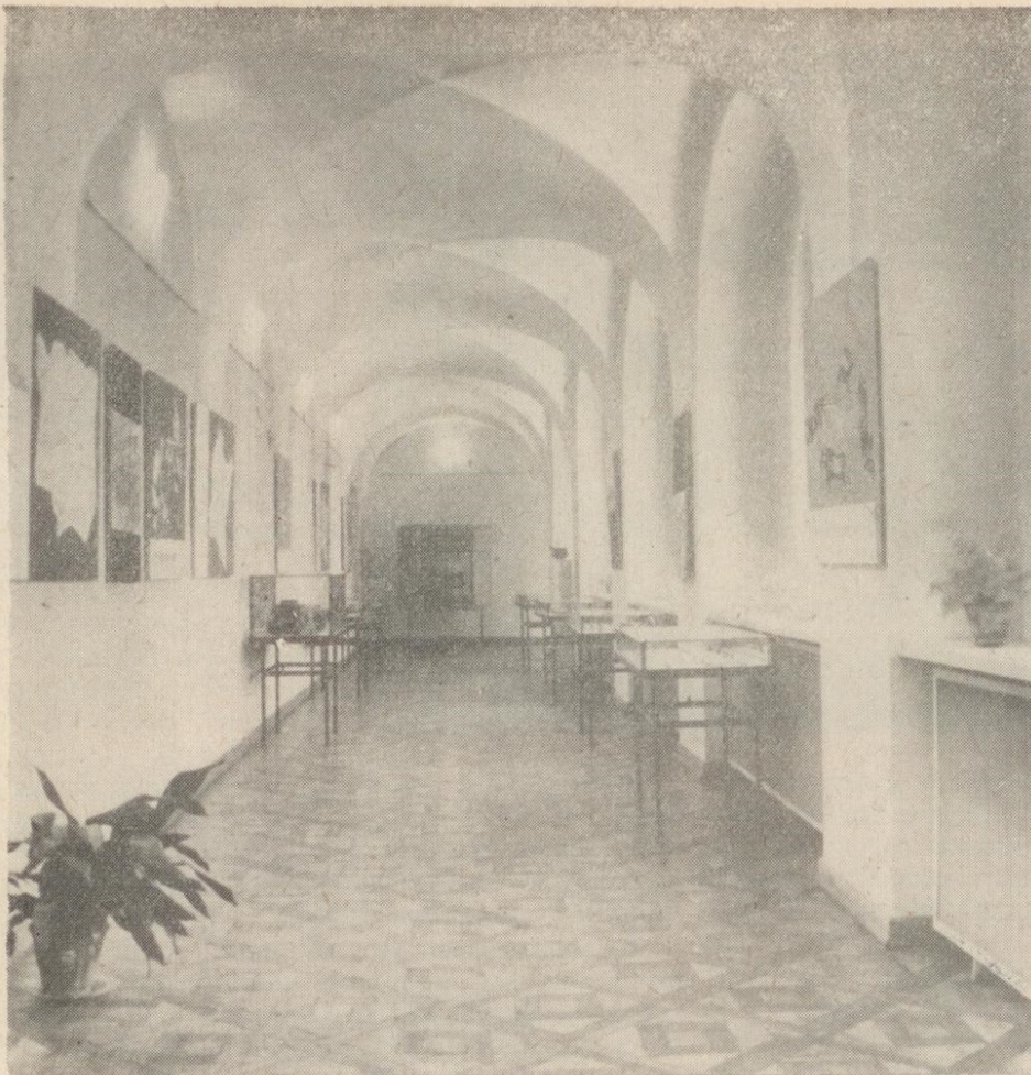
Ryc. 5. Fragment wystawy „Pradzieje Rzeszowszczyzny” w Muzeum w Rzeszowie.