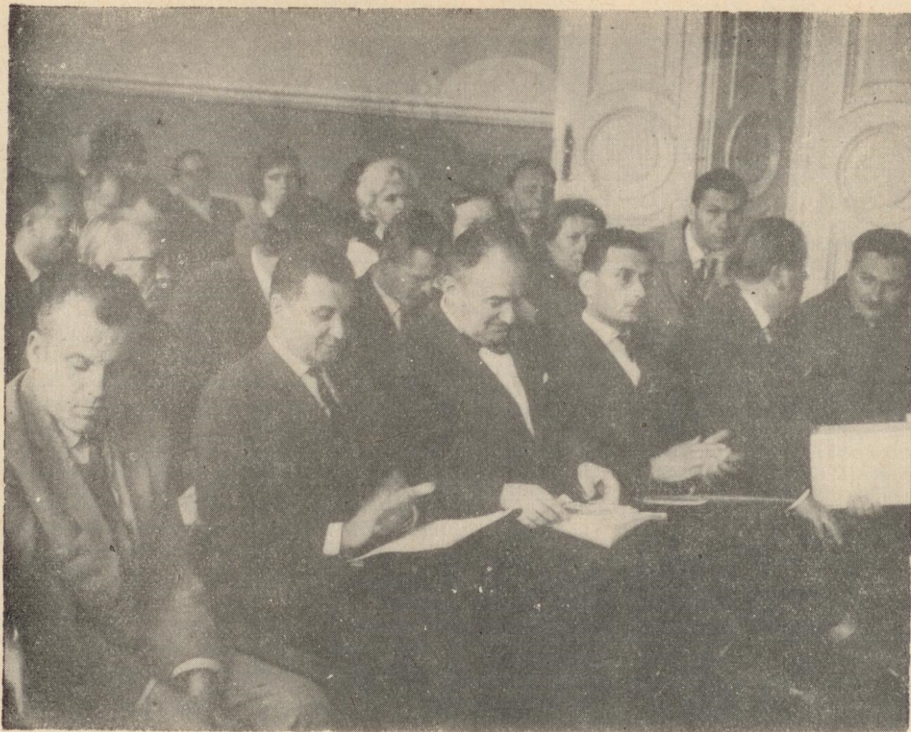
Ryc. 8. Seminarium „Współpraca muzeów ze szkołami” w Przemyślu.