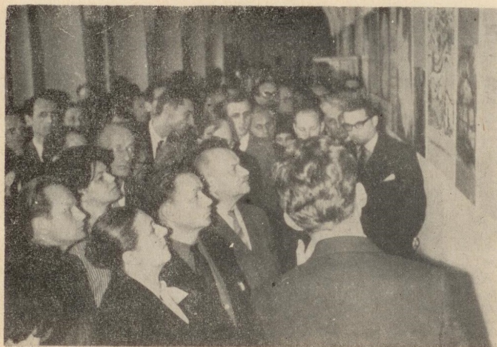
Ryc. 2. Z otwarcia wystawy archeologicznej Muzeum w Rzeszowie.

Osobny dział pracy Ośrodka stanowi wystawiennictwo. W Muzeum Okręgowym w Rzeszowie czynna była w 1964 r. stała wystawa