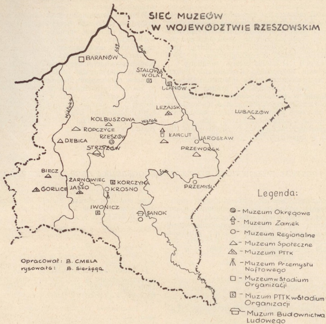
Ryc. 10. Sieć muzeów w województwie rzeszowskim.

Muzeum w Krośnie również przeprowadzało konserwację najbardziej zagrożonych wykopalisk lub tych eksponatów, które potrzebne były do podejmowania opracowań naukowych lub też do ekspozycji.