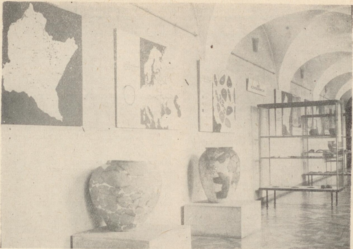
Ryc. 3. Fragment wystawy „Pradzieje Rzeszowszczyzny” w Muzeum w Rzeszowie.