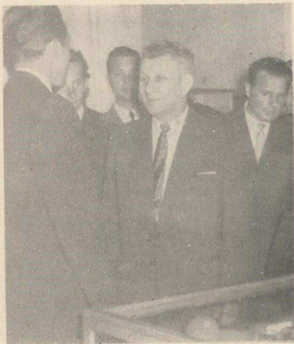
Ryc. 6. Wicepremier Julian Tokarski zwiedza wystawę archeologiczną w Przemyślu.

Obok eksponowanej wystawy stałej na miejscu w Muzeum w Rzeszowie zorganizowana też została wystawa czasowa w Sokołowie Młp., pow. Kolbuszowa, a to w związku z obchodami 400-lecia założenia miasta. Wśród zgromadzonych tamże eksponatów poważne miejsce zajmowały eksponaty archeologiczne, pochodzące z terenu samego Sokołowa, jak i najbliższej okolicy. Użyto do wystawy eksponatów zarówno ze zbiorów Muzeum Okręgowego w Rzeszowie jak i Muzeum Społecznego w Kolbuszowej. Wystawę Działu Archeologicznego dla Sokołowa przygotowali: T. Aksamit i A. Szałapata. Otwarcie wystawy odbyło się dnia 20 czerwca 1964 r. Wzięli w nim udział: dyrektor Muzeum w Rzeszowie dr Fr. Błoński, kierownik Działu