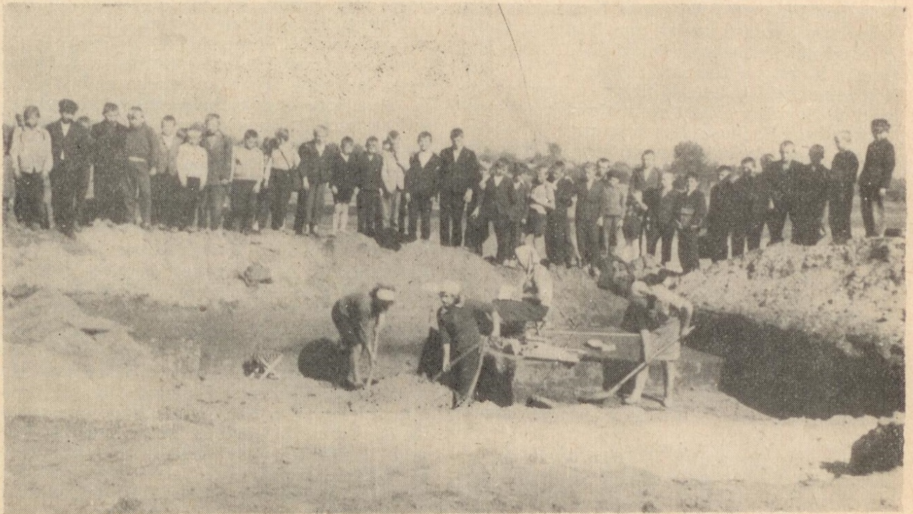
Ryc. 1. Teren wykopalisk w Otałęży, pow. Mielec zwiedza młodzież miejscowej szkoły.

Wszystkie placówki muzealne prowadziły też akcję odczytową w szkołach, świetlicach i domach kultury. Pracownicy Muzeum w Rzeszo-