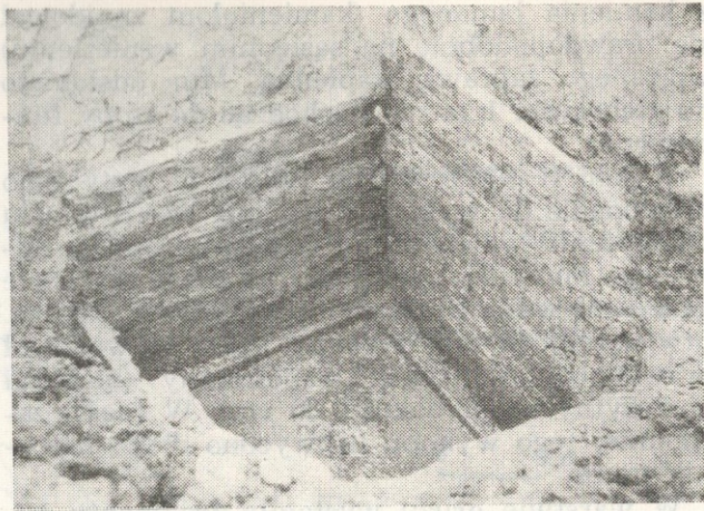
Ryc. 2. Sanok m. pow. Drewniana Konstrukcja nr 2.

W odległości kilku metrów od obiektu nr 1 i na głębokości 5,1—7,3 m odkryto również kwadratową drewnianą konstrukcję o wymiarach 1,2 \times 1,2 m (Ryc. 2). Ścianki utworzone były z dwu warstw drewna ściśle przylegających do siebie i również budowane na zrąb.