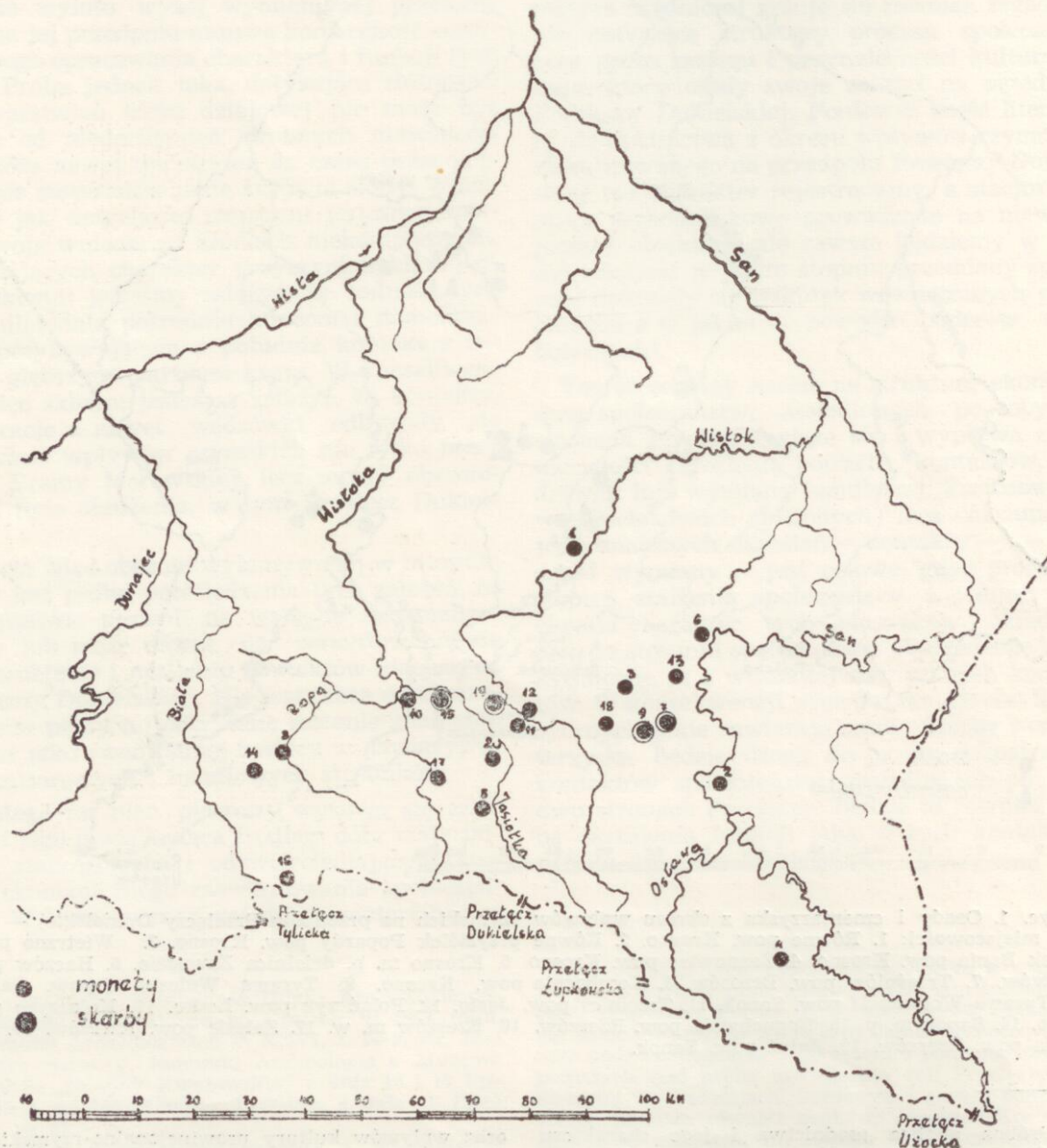
Ryc. 2. Rozmieszczenie monet i skarbów z okresu wpływów rzymskich na przedpolu Przełęczy Dukielskiej — wykaz miejscowości: 1. Babica pow. Rzeszów. 2. Biała Góra pow. Sanok. 3. Bus ków pow. Brzozów. 4. Cisna pow. Sanok. 5. Dukla pow. Krosno. 6. Dynów pow. Brzozów. 7. Gdyczyna pow. Brzozów. 8. Gorlice m. p. 9. Grabownica pow. Brzozów. 10. Jasło m. p. 11. Krosno m. p. 12. Krościenko Wyżne pow. Krosno. 13. Niebocko pow. Brzozów. 14. Szybnik pow. Gorlice. 15. Tarnowiec pow. Jasło. 16. Wyżowa pow. Gorlice. 17. Zmigród pow. Jasło. 18. Humniska pow. Brzozów. 19. Turaszówka pow. Krosno. 20. Wietrzno pow. Krosno. 21. Krosno m. p. dzielnica Suchodół.