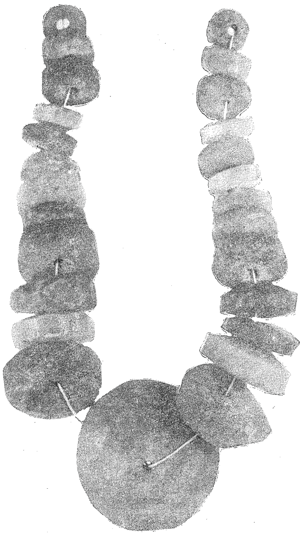
Ryc. 2. Świlcza, pow. Rzeszów, stan. 3. Paciorki bursztynowe

Jama nr 3 wystąpiła na głębokości 260 cm od powierzchni gruntu, wymiary jej wynosiły 220×200 cm. Ścianki jamy opadały skośnie w dół, dno znajdowało się na głębokości 320 cm. Wypełnisko stanowiła bardzo czarna ziemia, z wkładkami drobnych węgielków drzewnych, w dolnych partiach występowała duża ilość rdzawych nacieków. W jamie znaleziono fragmenty naczyń oraz kości zwierzęce. Spełniała ona zapewne funkcję jamy odpadkowej.