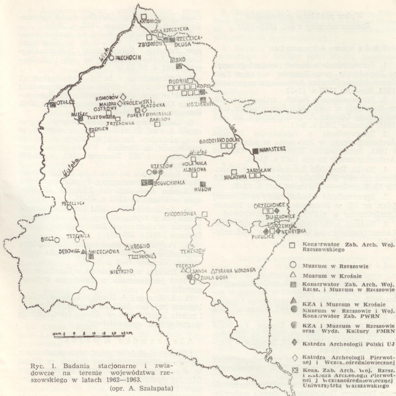
Ryc. 1. Badania stacjonarne i zwiadowcze na terenie województwa rzeszowskiego w latach 1962—1963. (opr. A. Szaląpata)

Niezależnie od badań archeologicznych prowadzonych przez placówki z terenu województwa rzeszowskiego, również Uniwersytet Jagielloński i Uniwersytet Warszawski prowadził na tym terenie prace badawcze.