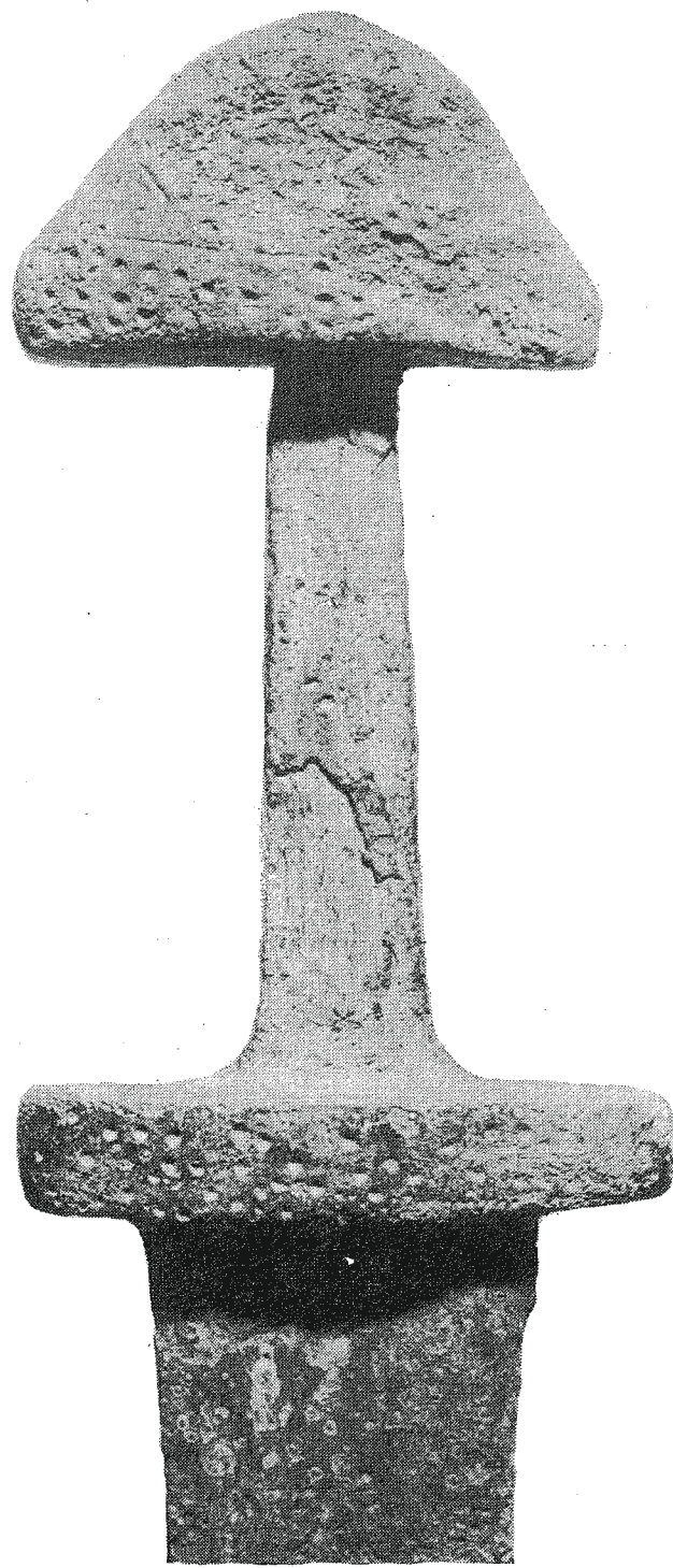
Ryc. 3. Radymno, woj. Przemyśl. Górna część miecza.