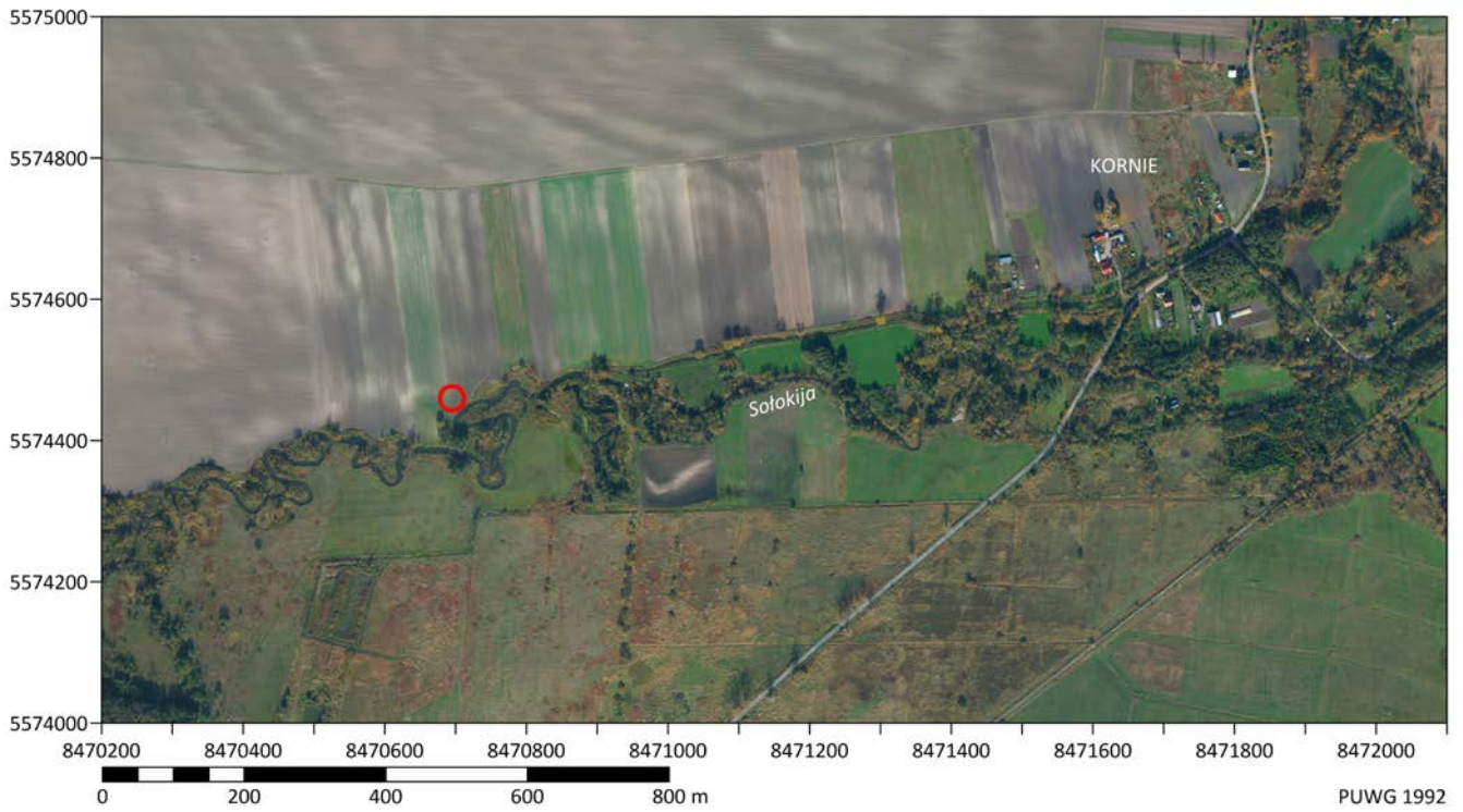
Ryc. 1. Miejsce odkrycia fragmentów noża brązowego w miejscowości Kornie, gm. Lubycza Królewska, pow. tomaszowski Fig. 1. A place of discovery of fragments of a bronze knife in Kornie, Lubycza Królewska commune, Tomaszów district