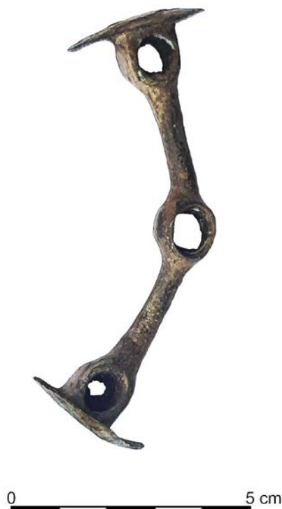
Ryc. 5. Mikulin: pobocznica. Fig. 5. Mikulin: a cheekpiece.