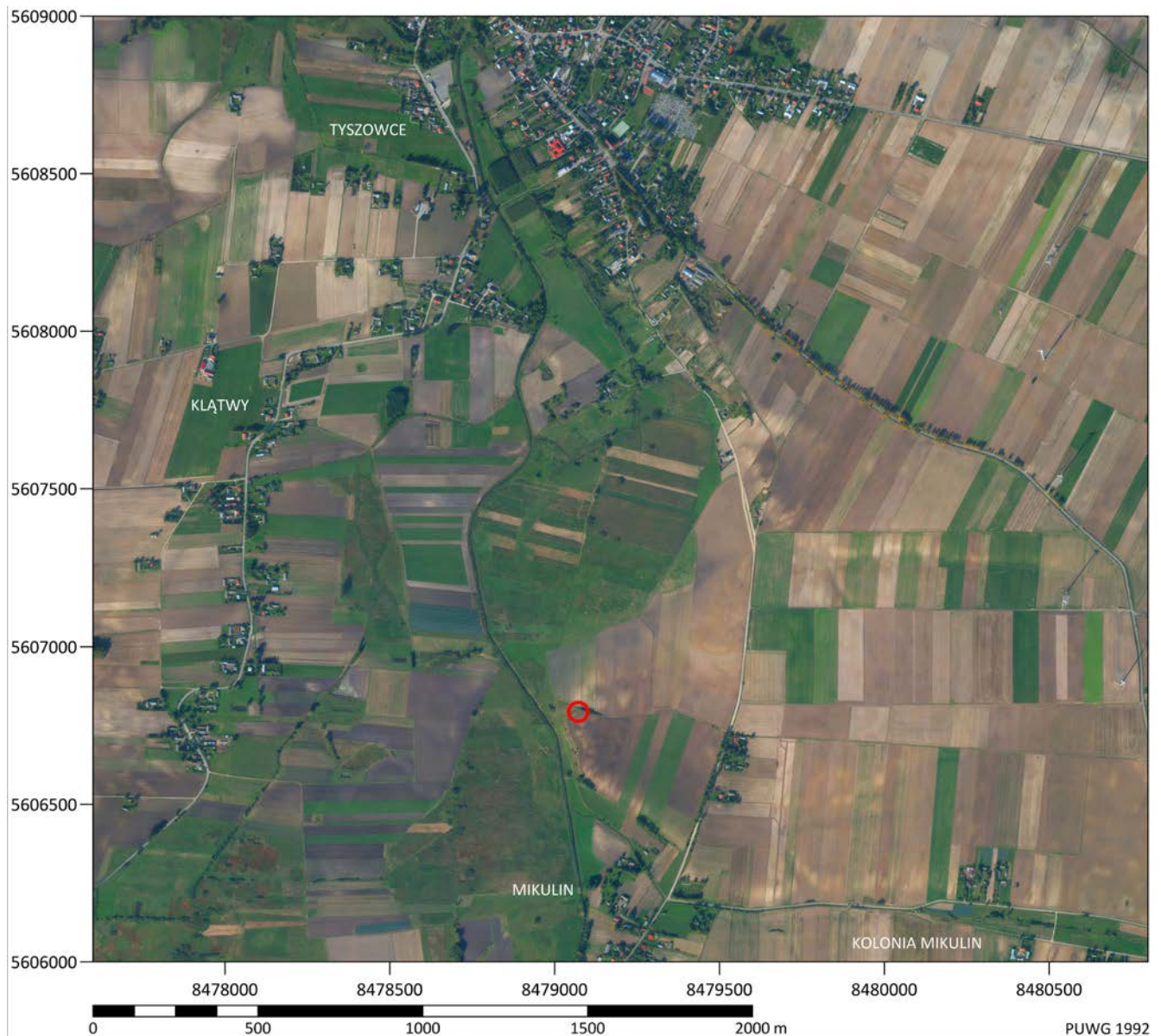
Ryc. 4. Miejsce odkrycia pobocznicy w miejscowości Mikulin, gm. Tyszowce, pow. tomaszowski Fig. 4. A place of discovery of a cheekpiece in Mikulin, Tyszowce commune, Tomaszów district

Bez wątpliwości mamy tu do czynienia z pobocznica, która w literaturze bywa określana jako typ Kamyševacha (Chochorowski 1993, 59–61) lub też typ 10 (Dietz 1998, 148–150). Na ziemiach polskich jest to pierwszy jak dotąd egzemplarz pobocznicy tego typu. Pobocznice typu Kamyševacha są notowane