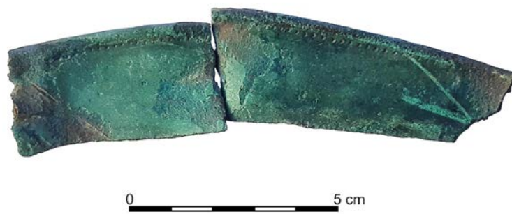
Ryc. 2. Kornie: fragmenty noża. Fig. 2. Kornie: fragments of a bronze knife.