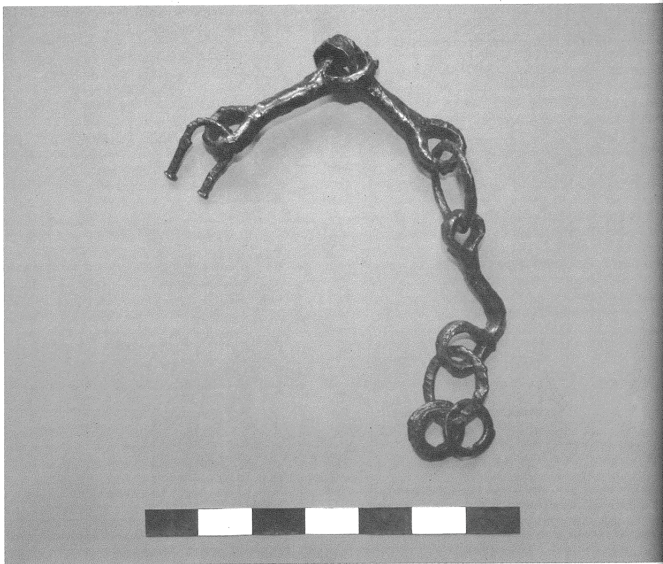
Ryc. 3. Wierzawice, pow. Leżajsk, stan. 18. Żelazne kielzno.