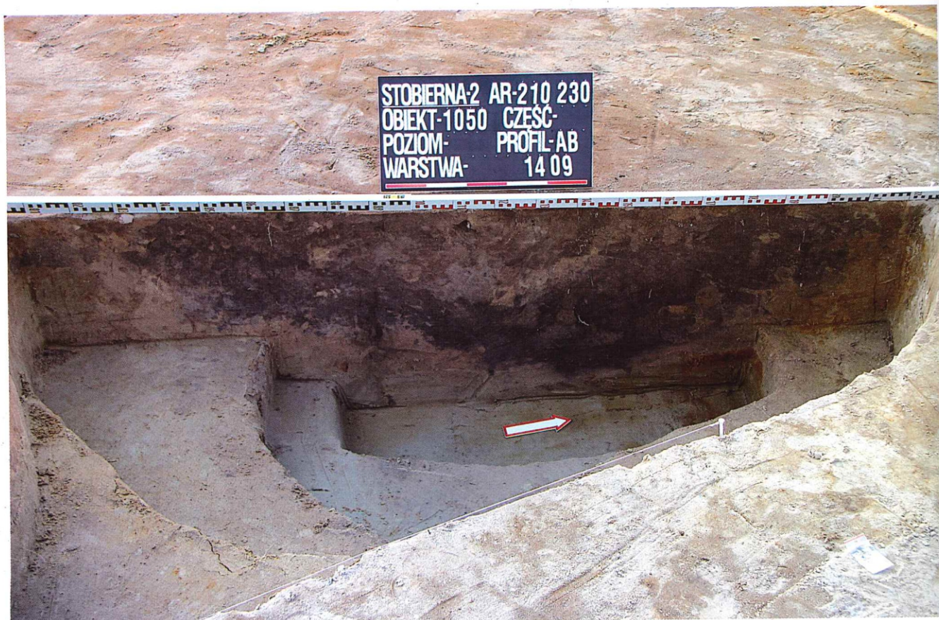
Fot. 4. Stobierna, stan 2. Obiekt 1050 w trakcie eksploracji Fot. 4. Stobierna, Stm. 2. Obiekt 1050 während der Explorierung Фот. 4. Стоберна, пам. 2. Объект 1050 в ходе раскопок