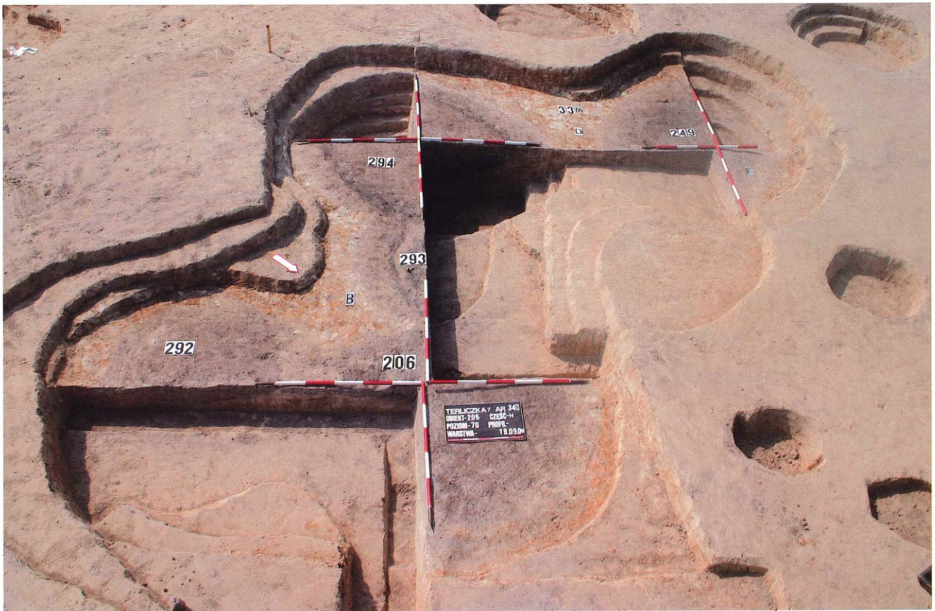
Fot. 1. Terliczka, stan. 7. Obiekty w trakcie eksploracji