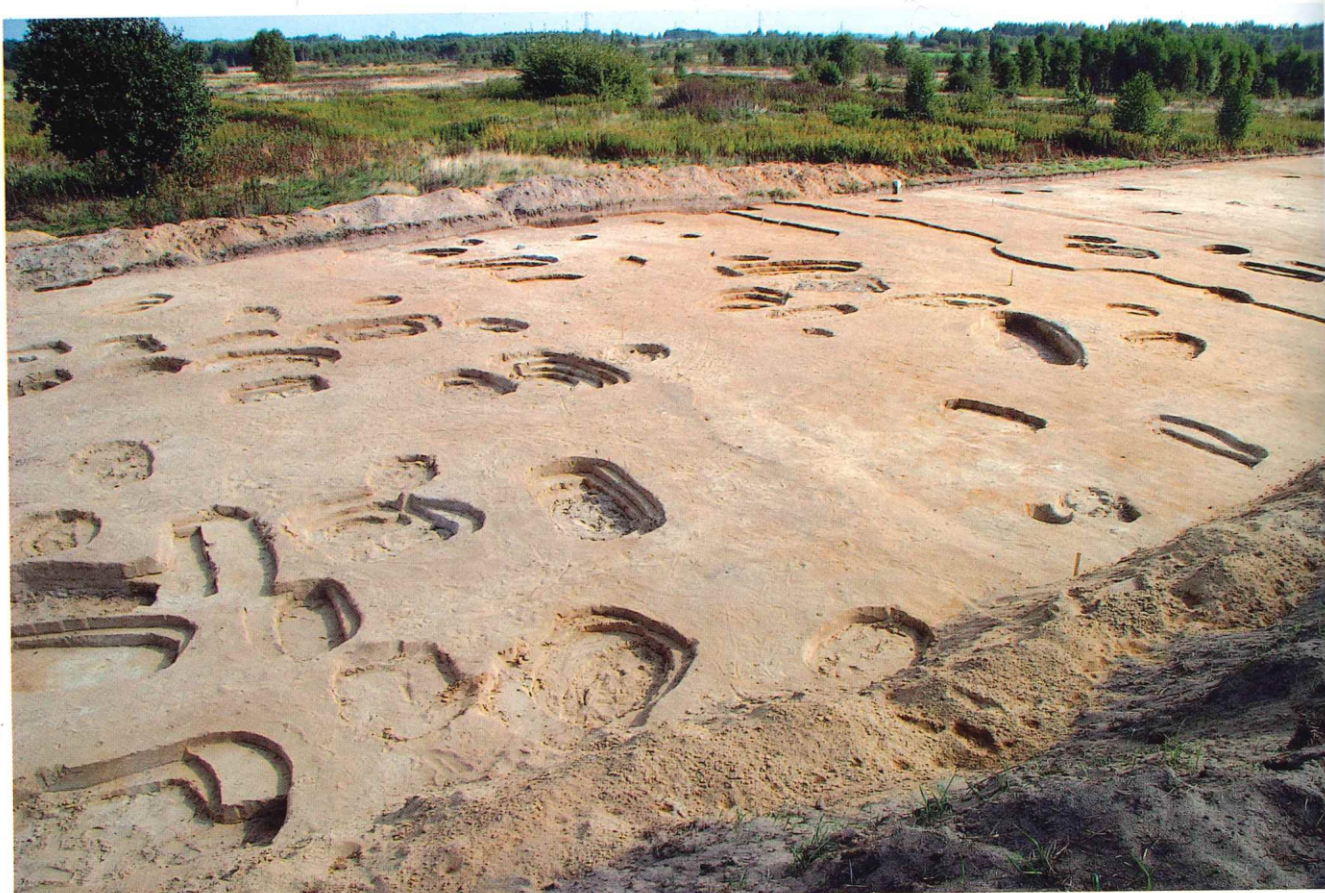
Fot. 3. Stobierna, stan. 2. Stanowisko w trakcie eksploracji Fot. 3. Stobierna, Fst. 2. Fundstelle während der Explorierung Фот. 3. Стоберна, пам. 2. Памятка в ходе раскопок