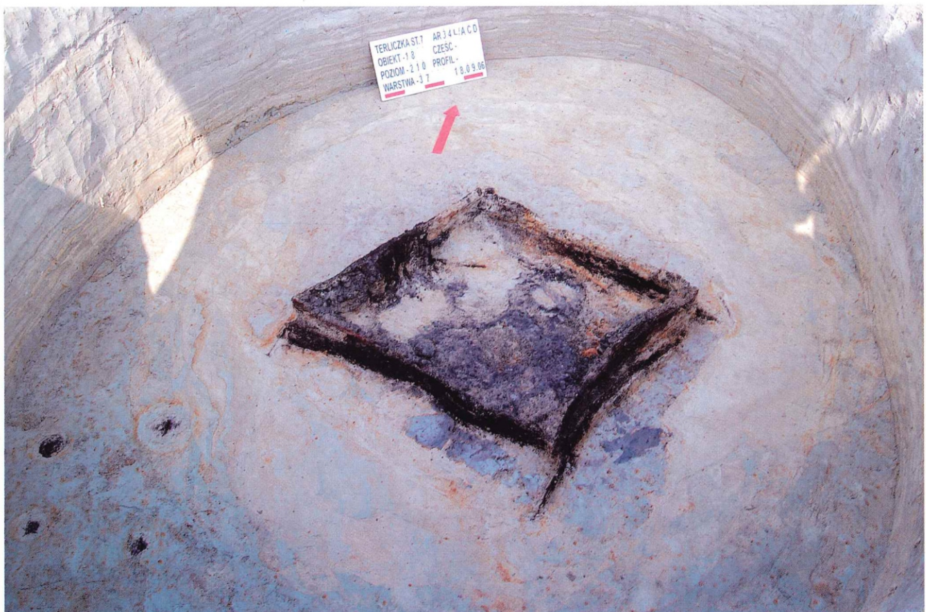
Fot. 2. Terliczka, stan. 7. Obiekt 18