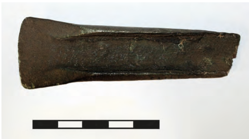
Ryc. 2. Zdjęcie zabytku