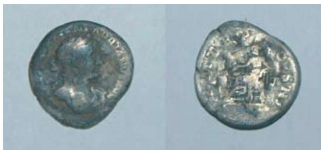
Fot. 3. Świrna, stan. 1. Denar Hadriana: awers-rewers.

RIC II, s. 352, nr 98. (H. Mattingly, E. A. Sydenham 1926)