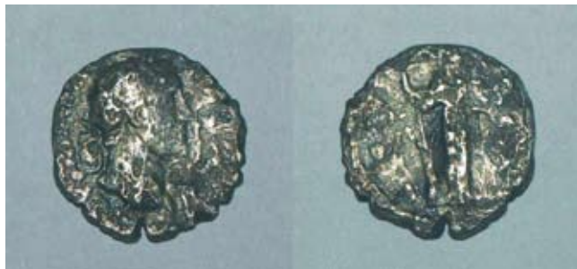
Fot. 5. Sandomierz, stan. 1. Denar Antonina Piusa: awers-rewers.

RIC III, s. 48, nr 179 (H. Mattingly, E. A. Sydenham 1930)