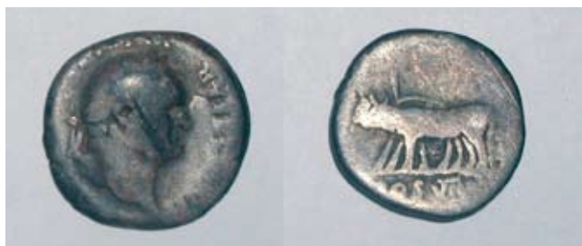
Fot. 1. Krzczonowice, stan. 61. Denar Wespazjana: awers-rewers.

RIC II/1, s. 127, nr 943. (I. A. Carradice, T. V. Buttrey 2007)