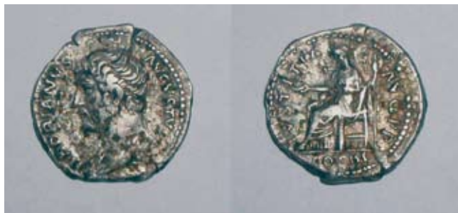
Fot. 4. Krzczonowice, stan. 63. Denar Hadriana: awers-rewers.

RIC II, s. 364, nr 215var. (H. Mattingly, E. A. Sydenham 1926)