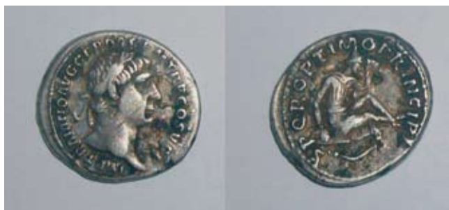
Fot. 2. Krzczonowice, stan. 63. Denar subaeratus Trajana: awers-rewers.

Cf. RIC II, s. 258, nr 219. (H. Mattingly, E. A. Sydenham 1926)