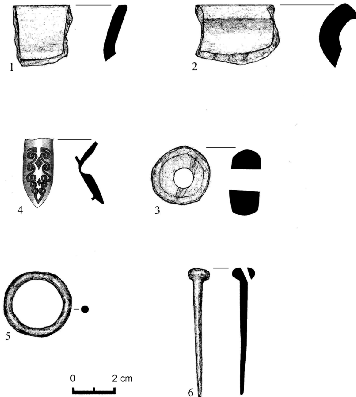
Рис. 2. Борисковичі (2009). Заплава: 1–3 – кераміка. 4–6 – метал

Деякі з представлених фрагментів усіх типів орнаментовані неглибокими паралельними врізними лініями по тулубу та плічках посудини, серед звичайних сірих