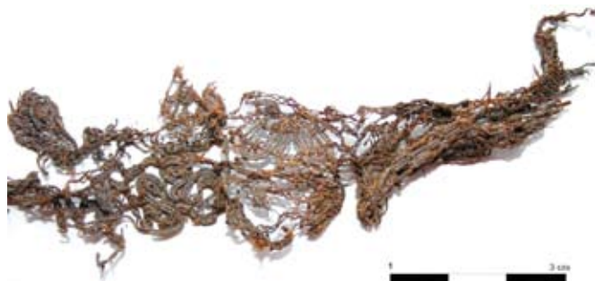
Ryc. 7. Resztki koronki klockowej (Fot. M. Troszczyńska) Abb. 7. Reste der Handklöppelspitze (Fot. M. Troszczyńska)

Dzięki zachowanym pozostałościom trumny wraz z wyposażeniem, można odtworzyć wygląd pochówku. Mianowicie sosnową trumnę obito tkaniną, dodatkowo przyozdabiając ją ćwiekami. Materiał użyty do wyrobu trumny, jak i zastosowanie tylko posrebrzanych ćwieków może świadczyć o celowym podniesieniu walorów artystycznych i prestiżu pochowanej osoby jednakże przy zastosowaniu minimalnych nakładów finansowych.