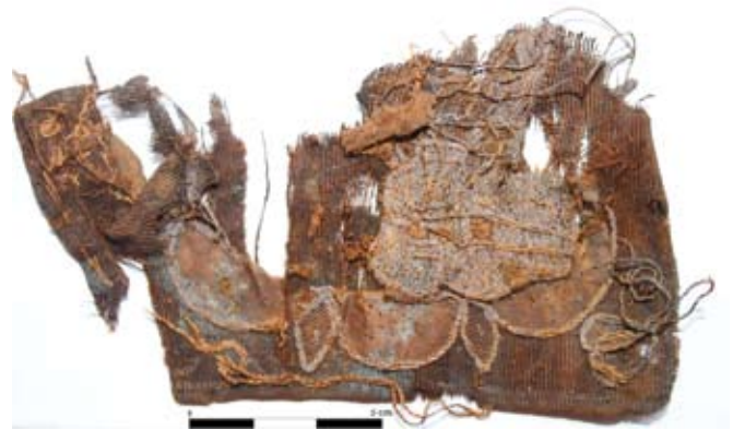
Ryc. 4. Fragment jedwabnej tkaniny z naszytymi elementami kompozycji zdobiącej (Fot. M. Troszczyńska) Abb. 4. Fragment eines seidenen Stoffes mit aufgenähten Zierelementen (Fot. M. Troszczyńska)

Oprócz tkanin pochodzących z wnętrza trumny, zachowały się również fragmenty materiału objającego trumnę z zewnątrz. Są one silnie spłisnione. Widać w nich otwory po ćwiekach. W przypadku dwóch fragmentów udało się określić, zastosowany splot. Jest nim, podobnie jak w przypadku zabytków wcześniej omówionych, splot płócienny 1/1. Różni się natomiast skrętem użytej przędzy. Jeden z fragmentów ma