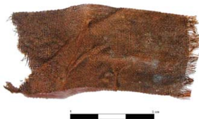
Ryc. 6. Fragment jedwabnej wstążki

Poza tkaninami, znaleziono również fragmenty 4 krajk wełnianych i 1 jedwabnej wstążki (ryc. 6). Zachowane wymiary jedwabnej wstążki, wykonanej w splotcie płóciennym 1/1, wynoszą 6 x 3 cm. Nici użyte do jej wykonania, zostały skręcone w lewo (SS). Grubość nici w osnowie ma około 0,17 mm, zaś w wątku 0,18 mm. Gęstość nici w osnowie