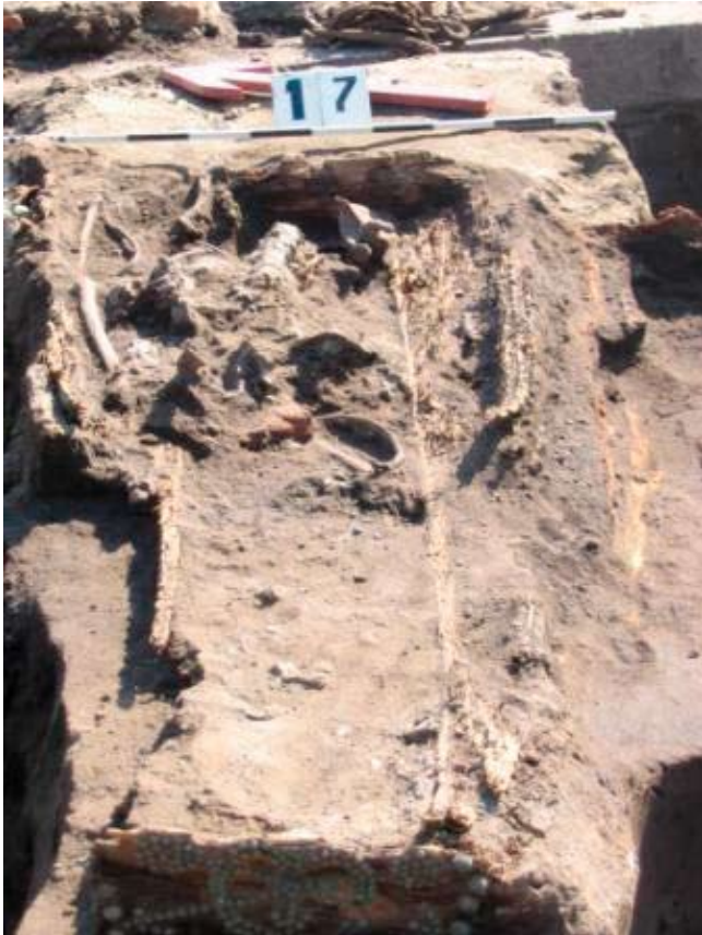
Ryc. 1. Grób 17 (Fot. G. Ziółkowska) Abb. 1. Grab 17 (Fot. G. Ziółkowska)

nieje również możliwość, że jest to wstążka zdobiąca włosy. Niestety, stan zachowania nie pozwala na określenie jej barwy. Jedwabne tkaniny z Jarosławia charakteryzują się podobnymi parametrami technologicznymi co materiały znalezione m.in. w Brześciu Kujawskim (Ł. Antosik, w druku), Mutowie (A. Sikorski 2002, s. 241–251), Elblągu, czy też Wieluniu (J. Maik 1997, s. 174).