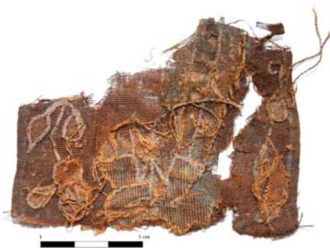
Ryc. 5. Fragment jedwabnej tkaniny z naszytymi elementami kompozycji zdobiącej