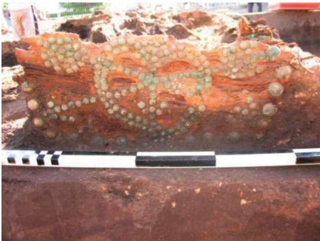
Ryc. 2. Zachowane elementy zdobienia na trumnie (Fot. G. Ziółkowska) Abb. 2. Erhaltene Verzierungselemente des Sargs (Fot. G. Ziółkowska)

Oprócz wyżej wymienionych materiałów jedwabnych, w trakcie eksploracji trumny, uzyskano trzy fragmenty jedwabne innej tkaniny. Pozostałości te utkane zostały rów-