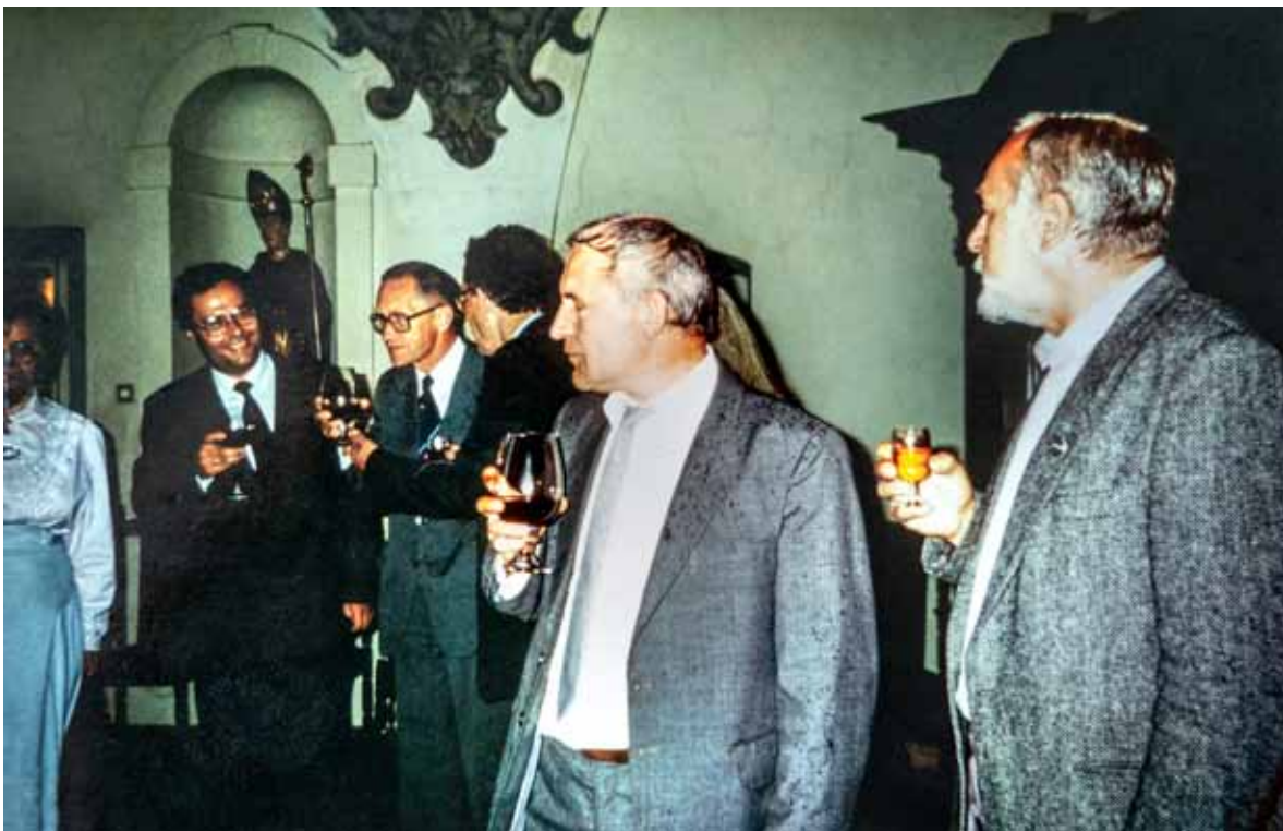
Ryc. 5. Spotkanie towarzyskie w trakcie konferencji „Ziemie polskie we wczesnej epoce żelaza i ich powiązania z innymi terenami”, Muzeum Okręgowe w Rzeszowie, wrzesień 1991. Pierwszy z prawej – profesor Tadeusz Malinowski